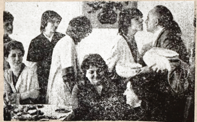
Са свечаности у МИ „Металац“

Иначе, Актив за друштвену активност жена „Металац“ организовао је пријем жена чачанског „Техноса“, „Југобанке“, МК „Рудник“, својих пензионерки и радница. После обиласка производних погона и изложбе ручних радова радница „Металац“, при-