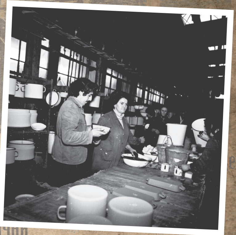
У 19... Предвиђе... дукт пред...